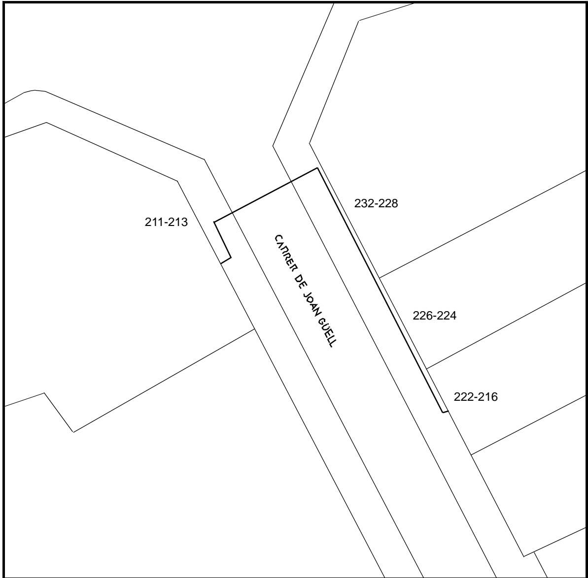
Plànol de situació de la rasa.